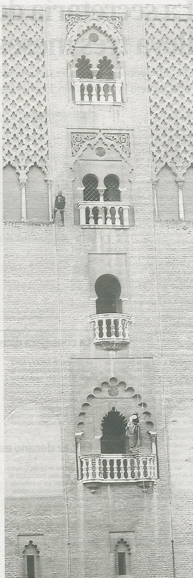
Dos operarios examinaron ayer una de las fachadas de la Giralda.

En total, la revisión de esta primera fachada concluyó a mediodía con la recogida de un saco completo de basura, generada fundamentalmente por los cientos de visitantes que suben al campanario de la torre cada día. Está previsto que la limpieza continúe hoy por las restantes facha-